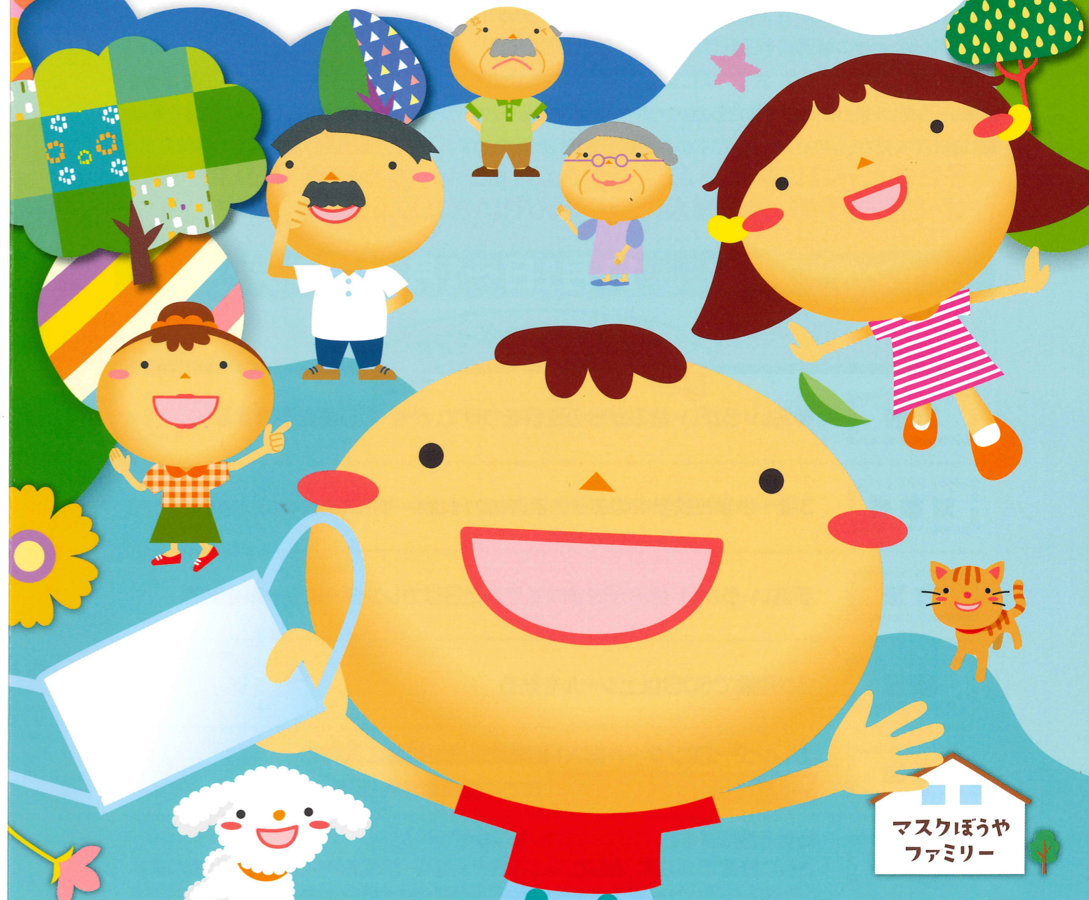
マスクぼうやファミリー