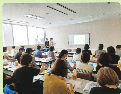
動きやすい服装でお越しください