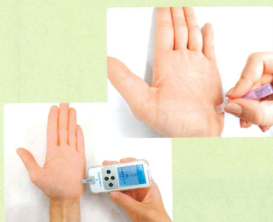
昼食前、食後の計5回測定