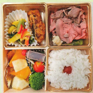
栄養バランスの解説